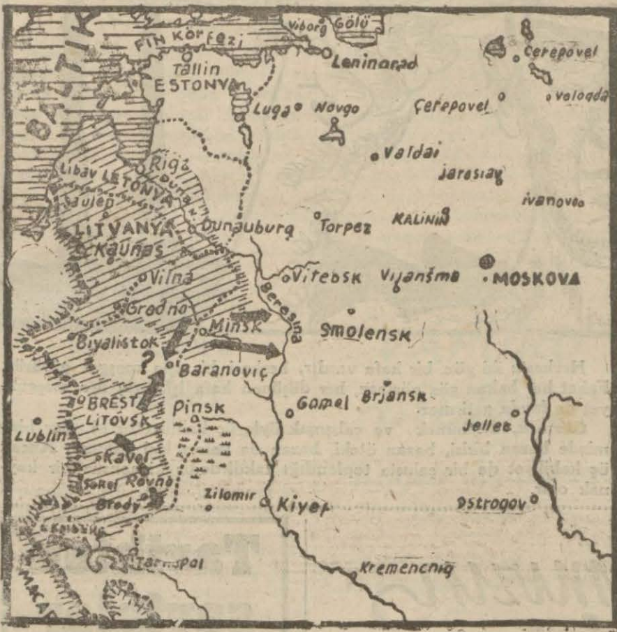
İki taraf ordularının bulunduğu mevkiileri gösteren harita

Stalin, işçilere, köylülere hitab ederek, harbin zarurî icabatı olarak ordu çekilirken, düşmana bir tek lokomotif, bir tek vagon, bir tek depo terk edilmesini tavsiye etmiş ve Kızıldorunun mutlak kudretine ve zaferine olan itimadından bahsetmiştir.