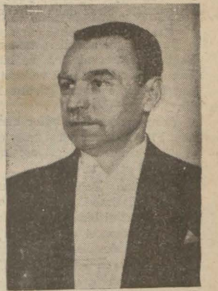
Dahiliye Vekili Faik Öztrak hiliye Vekâletinin bu hareketi nasıl telâkki eylediğini sormakta idi. Dahiliye Vekilinin cevabı Dahiliye Vekili Faik Öztrak (Arkası sayfa 6 sütun 5 te)

Refik İnce bu sual takririnde İstanbul belediyesinin asker ailelerine yardım için nakil vasıtaları sinema ve tiyatro ücretlerine yapmak istediği zammın mahiyetini itibarile teşkilâtı esasıye kanunu ile 1111 numaralı kanuna mugayir olduğunu işaret eylemekte ve Da-