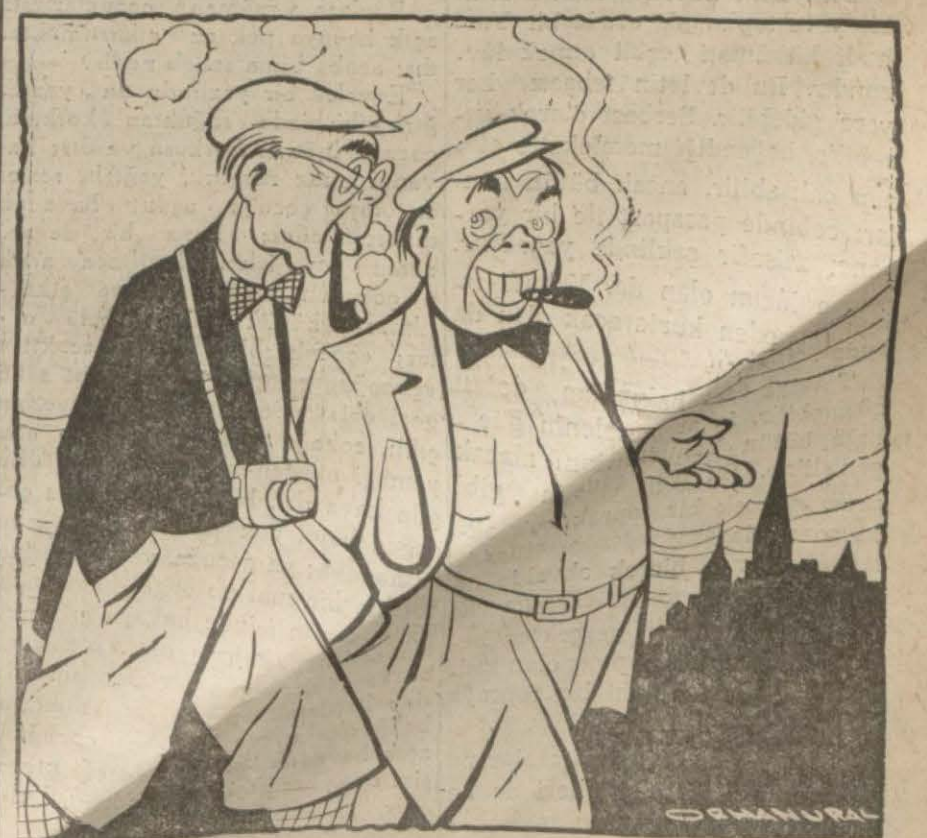
— Şu Amerika harbe ne zaman girecek dersin? — Nazırlarının beyanatlarına bakılırsa haftada birkaç defa gırip çıkıyor

Dünkü Alman resmî tebliği Minsk'in 90 kilometre kadar şarkındaki Beresina nehrine kadar ilerlemeğe muvaffak olduklarını bildirmiştir. Dünkü Sovyet tebliği de bu zırhlı ve motörlü Alman kuvvetlerine karşı karadan ve havadan şiddetli taarruzlar yapıldığını, fakat bu Alman kuvvetlerinin adedince üstün olduklarını bildirmekte bu hâdiseyi kabul etmiştir. Minsk (Arkası sayfa 7 sütun 1 de)